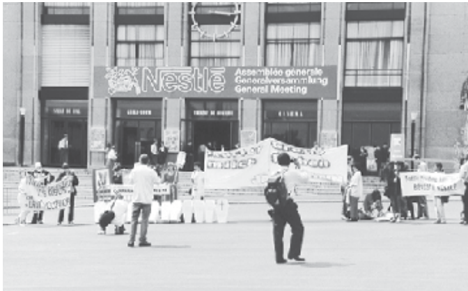
AGB-Vertreter demonstrieren bei der jährlichen Nestlé-Aktionärsversammlung in Lausanne

Nestlé sagt auf ihrer Webseite, dass sie mindestens 8 500 Produkte anbietet. Somit ist ein kompletter Überblick kaum leistbar. Als Anlage beigefügt ist die aktuelle deutsche Nahrungs- und Genussmittel-Palette. Die AGB nimmt dankbar jeden darüber hinaus gehenden Hinweis entgegen.