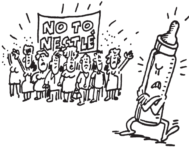
Cartoon: Grupo Origem, Brasilien

Der NESTLÉ- BOYKOTT zielt darauf ab, mit dem Nichtkauf von Nestlé-Produkten den Konzern zur Änderung seiner unethischen Vermarktungspraktiken zu bewegen, die das Stillen behindern und somit die Säuglingsgesundheit weltweit gefährden.